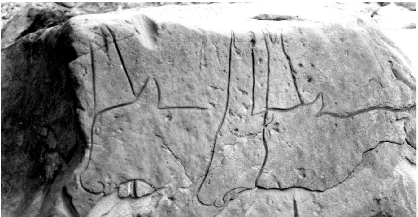
Fig. 2. Jebel Nuqay (Libye). Trois protomées de bovinés. Celui de gauche est doté d'une pendeloque circulaire comparable à celle de la fig. 1, mais dont toute la surface est profondément creusée. Celui de droite était également doté d'une pendeloque que le bris de la roche ne laisse qu'en partie visible. On remarquera le soin apporté au dessin des mufles, et la manière particulière de rendre les cornes et les oreilles.

GANDINI, J. 1999, Petit guide pratique avec itinéraires GPS (880 points), Libye du Sud-Est , Calvisson, Extrême'sud Éditions, 200 p.