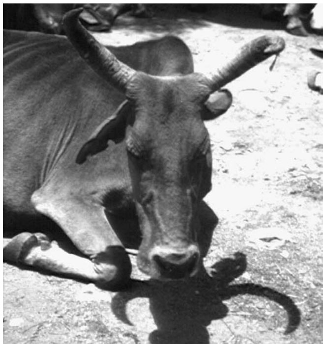
Fig. 3. Boviné à bosse photographié à Harla (Éthiopie). Vue de face : remarquer l'asymétrie des cornes, et le marquage des oreilles.