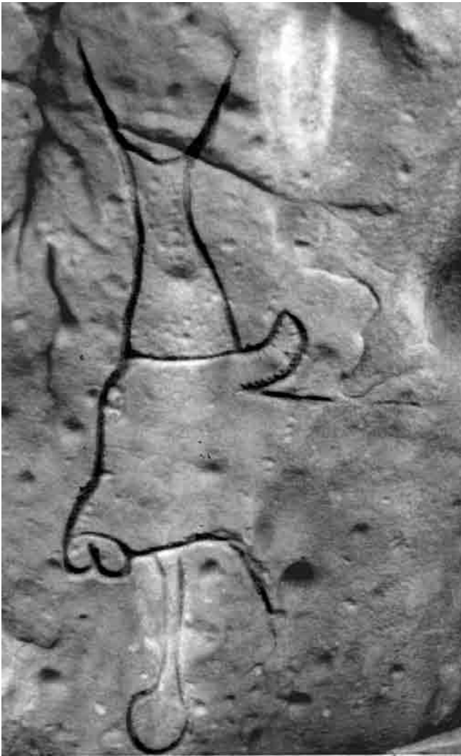
Fig. 1. Jebel Nuqay (Libye). Protomée de boviné à pendeloque circulaire.

certain angle. Néanmoins, il reste à savoir si la valorisation régulière de cette façon de voir, associée à d'autres traits particuliers, pourrait contribuer à la définition d'un style déterminé.