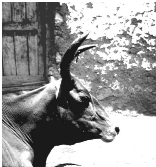
Fig. 4. Le même animal, vu de profil : l'effet de perspective donne bien l'illusion d'une seule corne, à extrémité bifide.